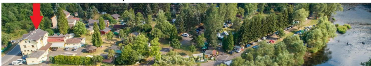
Místo srazu 25.08.2023 GPS Restaurace a hotel Na Špici Radošov: 50.2703914N, 12.9946042E