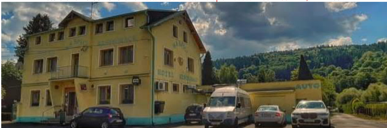
Místo v honitbě GPS v honitbě „BUFET“ u Javorenského rybníka: 50.1804311N, 13.0734756E